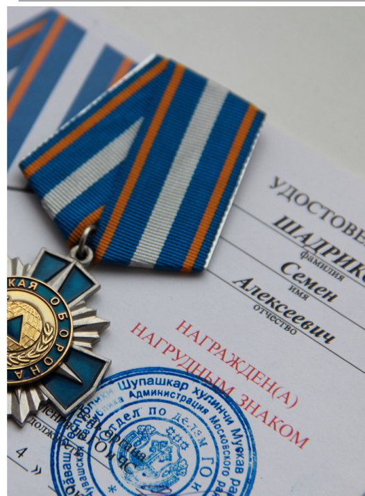
Нагрудный знак: «85 лет гражданской обороны»